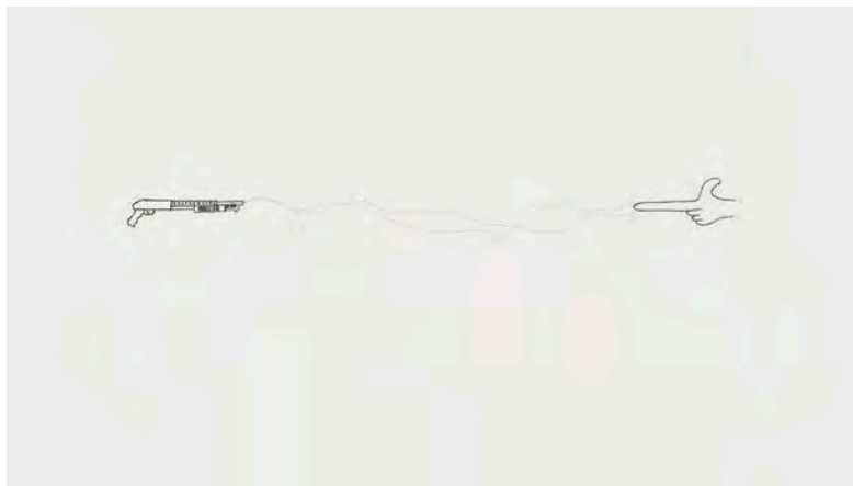
JEAN-PIERRE GAUTHIER Bang! Bang! te mort , 2017 Dessin au graphite et fils électrifiés 50cm x 64cm x 10cm (20" x 25" x 4") encadrée

Jean-Pierre Gauthier est récipiendaire du prestigieux Prix Sobey pour les arts (2004), du Prix Victor Martyn Lynch-Stauton (2006) et du Prix Louis-Comtois (2012). Il est reconnu pour ses installations cinétiques et sonores monumentales, comme l'œuvre Orchestre à géométrie variable , qui fut exposée au Musée d'art contemporain en 2016. Maintenant, les collectionneurs ont la chance d'acquérir des œuvres plus petites et intimes réalisées par Gauthier, dont deux nouveaux dessins interactifs présentés à Papier, trois sculptures interactives et cinétiques ainsi que deux nouvelles œuvres sonores.