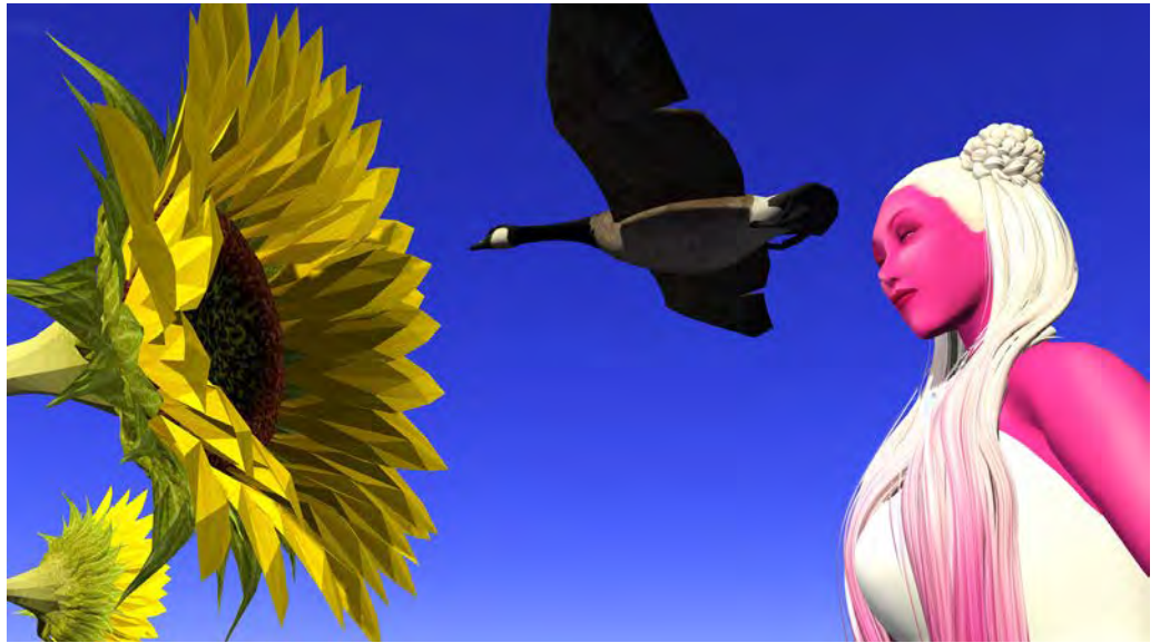
SKAWENNATI Renewal : She Falls for Ages , 2017 Machinimagraphes, impression jet d'encre 86cm x 152cm (33.75" x 60") Edition of 2 + 1AP

Cette année à la foire Papier, ELLEPHANT présente les machinimagraphes de Skawennati issus de sa nouvelle vidéo She Falls for Ages , et de l'oeuvre renommée TimeTraveller™ , une vidéo qui sera présentée cette année au HyperPavillon de la 57e Biennale de Venise. Des éditions limitées de ses machinimas et de ses machinimagraphes sont présentées à la foire Papier et à la galerie ELLEPHANT.