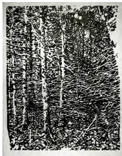
MARA KORKOLA No Place 388 , 2016 Impression par bloc (huile) sur papier de riz Édition 1/7 46m x 36cm (18" x 14")

Mara Korkola est une peintre canadienne chevronnée, reconnue pour ses paysages naturels et urbains. Depuis 2001, elle développe la série No Place . L'ensemble de cette œuvre picturale dépeint des lieux qui nous semblent familiers ; ils sont à la fois partout et nulle part. Suite à l'expérience de ces œuvres, le spectateur habite son environnement immédiat avec une appréciation renouvelée. Korkola présentera son plus récent travail à la galerie Nicolas Metivier en juin 2017. À Papier, deux paysages forestiers sont présentées, et d'autres de ses peintures à l'huile sont disponible à la galerie ELLEPHANT.